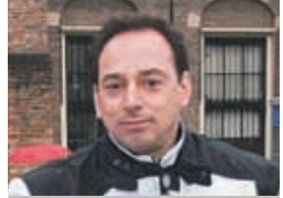
Sander Parmentier Freelance fotograaf en student Toegepaste Fotografie en Beeldcommunicatie